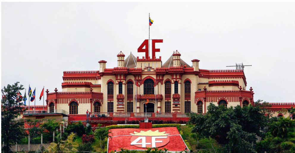
Cuartel de la Montaña 4F

El trabajo de encuadramiento realizado por el gobierno venezolano, al emplear este espacio para que fuese el mausoleo presidencial, influyó en la resignificación del lugar ya que se transformó al Cuartel en un sitio desde el que las distintas corrientes políticas y actores sociales que forman parte de la Revolución Bolivariana construyen y transmiten sentidos del pasado reciente utilizando para ello dispositivos tales como: bustos, fotografías y placas, entre otros soportes físicos, donde la figura de Chávez emerge como eje central de articulación. Lo anterior se entiende con palabras de Pollak quien afirma que "además de la producción de discursos organizados en torno a acontecimientos y a grandes personajes, los rastros de ese trabajo de encuadramiento son los objetos materiales: monumentos, museos, bibliotecas, etc." (2006: 27).