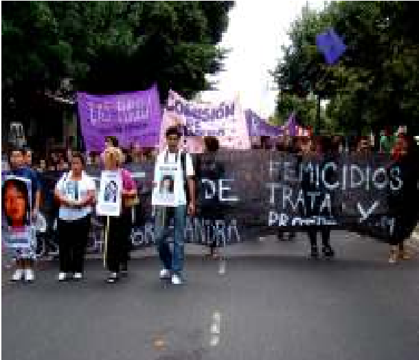
22 de agosto de 2011