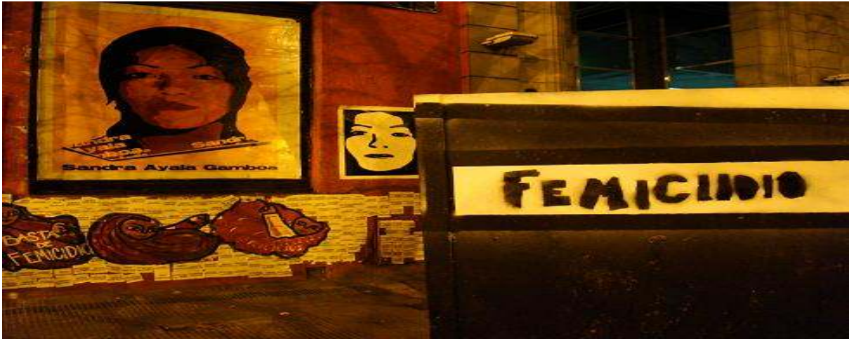
22 de febrero de 2011: 4 años