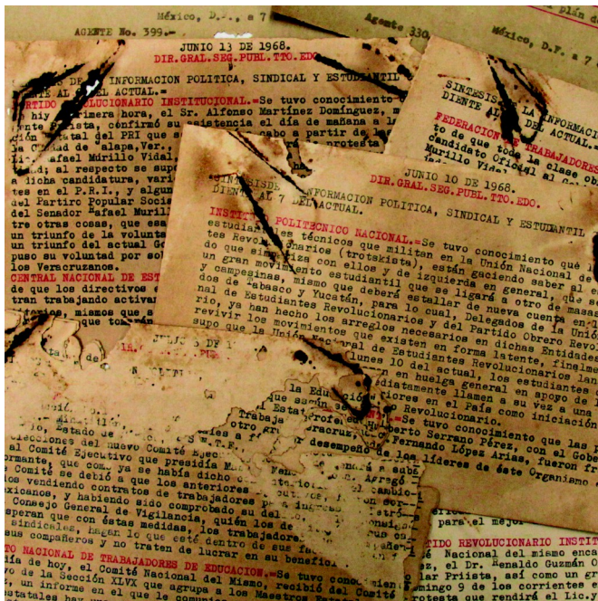
Fondo Fernando López Arias

La información sobre estos hechos y desde la óptica del poder se complementan en el fondo incorporado de Fernando López Arias , (8 de agosto de 1905 - 3 de julio de 1978) quien fue un político mexicano, ex gobernador de Veracruz, abogado, juez y agente del Ministerio Público en diversos pueblos y ciudades veracruzanas, presidente del Partido Nacional Revolucionario en Veracruz, Secretario General de la Confederación Nacional Obrero Popular (C.N.O.P.). Su acervo integrado por 5635 fojas de las cuales 5525 son fotocopias de informes y síntesis de informes, 29 telegramas, muchos de ellos cifrados, recortes y piezas hemerográficas, vinculados al movimiento estudiantil del 68. Se trata de reportes de agentes especiales del gobierno federal que día a día monitoreaban las actividades efectuadas por estudiantes y organizaciones civiles vinculadas o simpatizantes con ese movimiento político, con el propósito de mantenerlo enterado, seguramente para que el gobierno del presidente Gustavo Díaz Ordaz contara con su opinión logística.